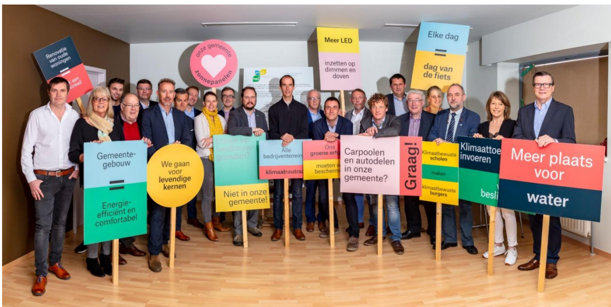
Foto: ondertekening door de 21 steden en gemeenten op de stuurgroep Klimaatgezond Zuid-Oost-Vlaanderen op 26 maart 2019

Uit het regionale klimaatplan kwam een top 20 van prioritaire maatregelen naar voor die in de komende 3 jaar zullen worden voorbereid en uitgerold op eigen grondgebied. De 8 besturen die nu instappen engageren zich, net als de overige 13, om trekker te zijn van 3 maatregelen.